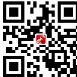
移动图书馆客户端