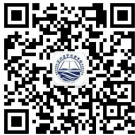
图书馆微信公众号